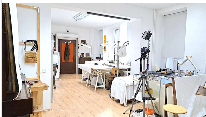
Atelier Blick 2