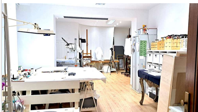
Atelier Blick 1